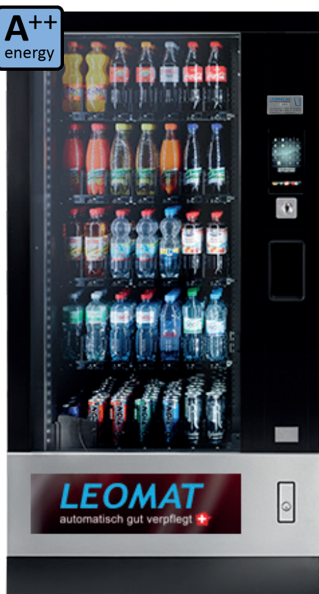
Robimat Touch. Produktlayout kann variieren.