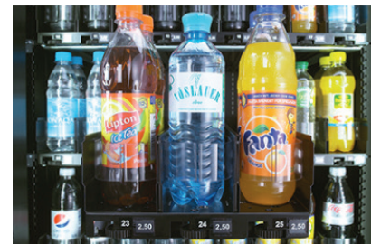
Transparente Produkthaltefedern für uneingeschränkte Sicht auf die Getränke.

Gerne stellen wir Ihnen den Robimat Touch sowie mögliche Optionen (bspw. unsere verschiedenen Bezahl- und Informationssysteme) persönlich vor. Wir freuen uns auf Ihre Kontaktaufnahme.